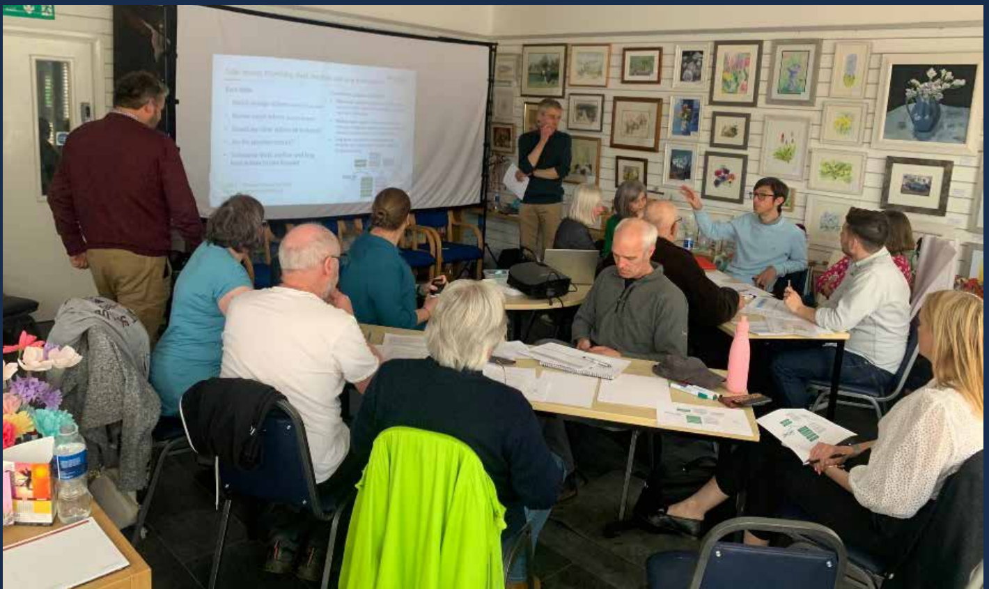
Llun: Gweithdy cymunedol

https://www.spenergynetworks.co.uk/pages/the_net_zero_fund_t2.aspx