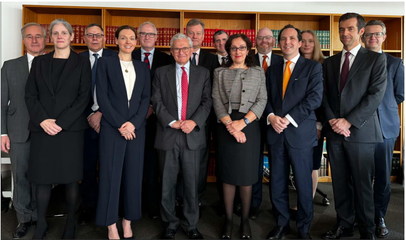
Meistr y Rholiau (canol, blaen) gyda chyd-aelodau ac ysgrifenyddiaeth y Pwyllgor Rheolau Trefniadaeth Sifil