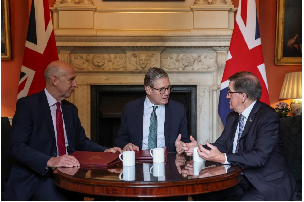
Y Prif Weinidog Keir Starmer (canol) a'r Ysgrifennydd Gwladol dros Amddiffyn John Healey (chwith) yn cwrdd â'r Arglwydd Robertson (dde) pennaeth Adolygiad Amddiffyn Strategol y Llywodraeth.