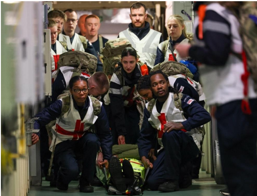
Swyddogion cymorth cyntaf gyda chlaf yn ystod Ymarfer Damwain ar Fwrdd Llong yr HMS Tywysog Cymru ynghyd â Sgwadron Awyr y Llynges 809.