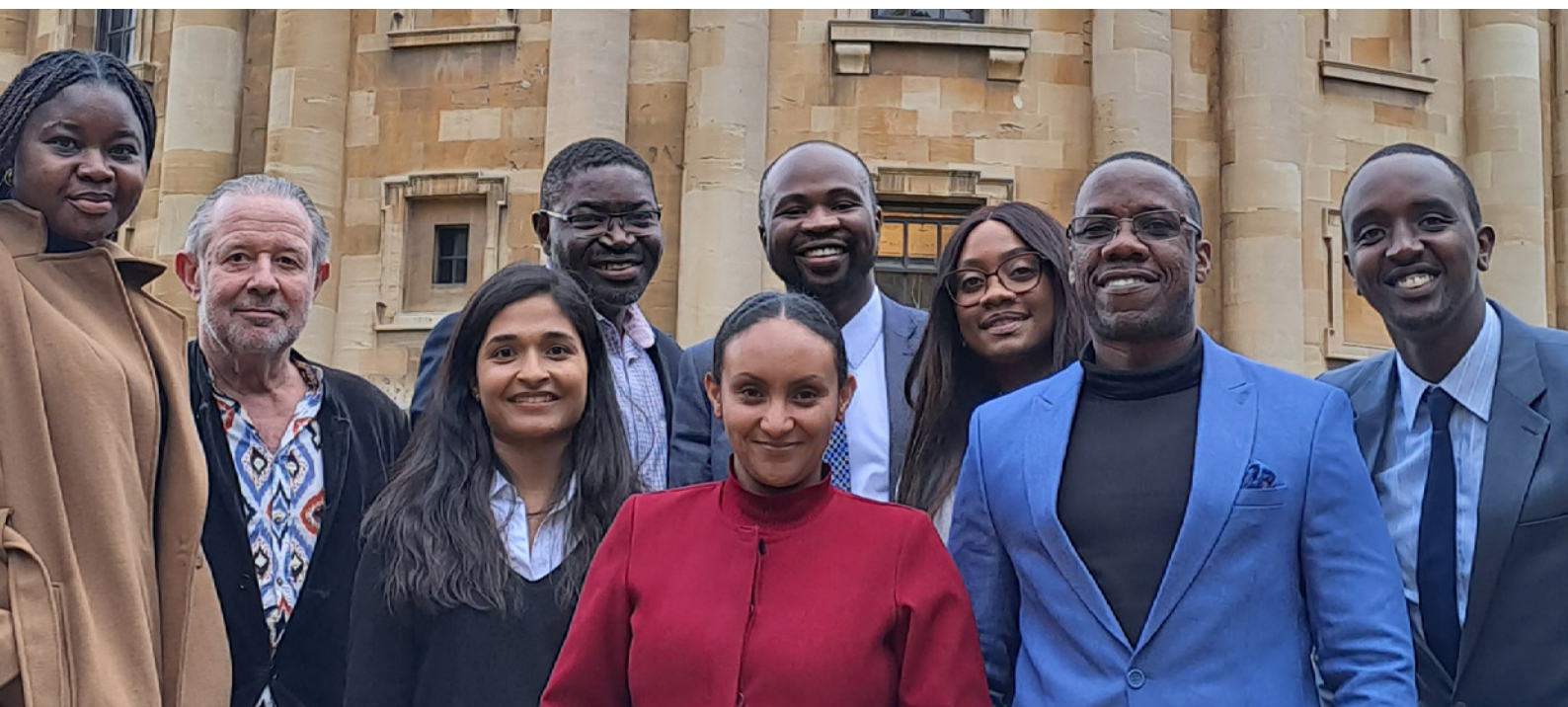
Formation de juristes visiteurs dans le cadre du programme International Lawyers for Africa