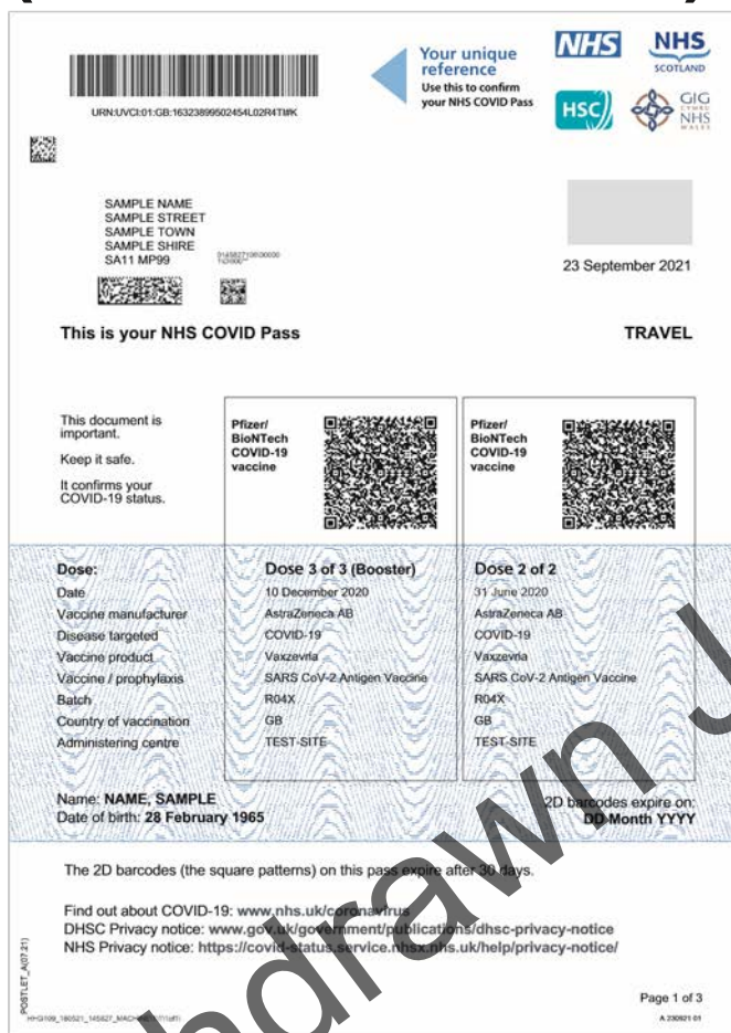
Ejemplo: Página 1