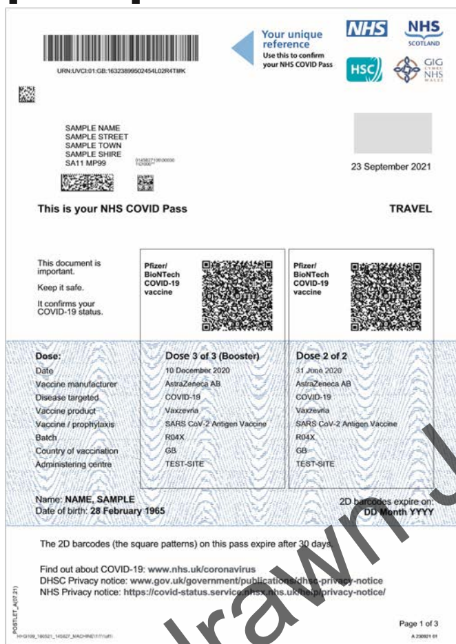
Przykład: Strona 1