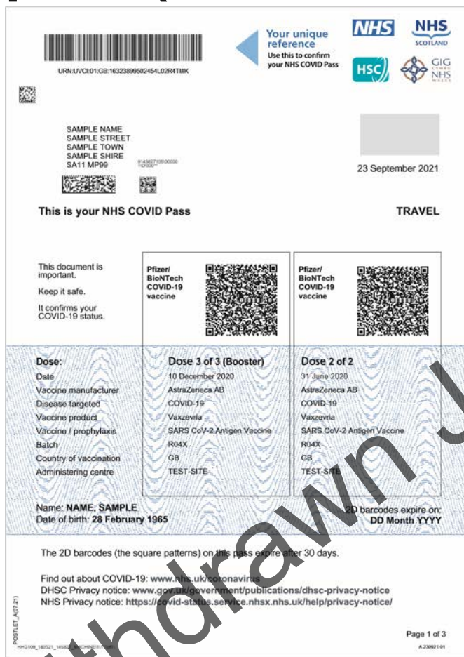
Pavyzdys: 1 psl.