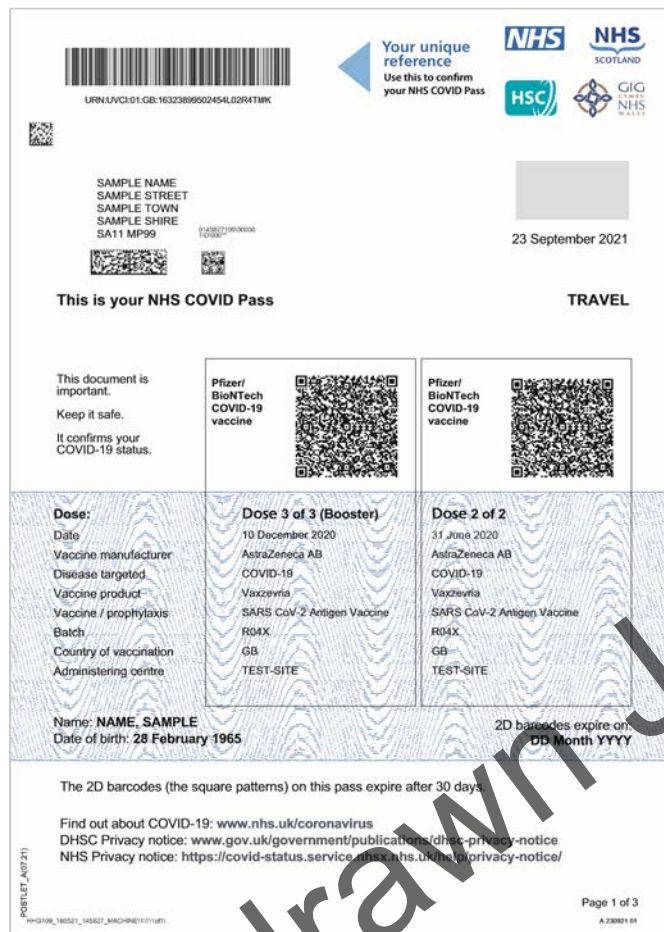
Exemple : Page 1