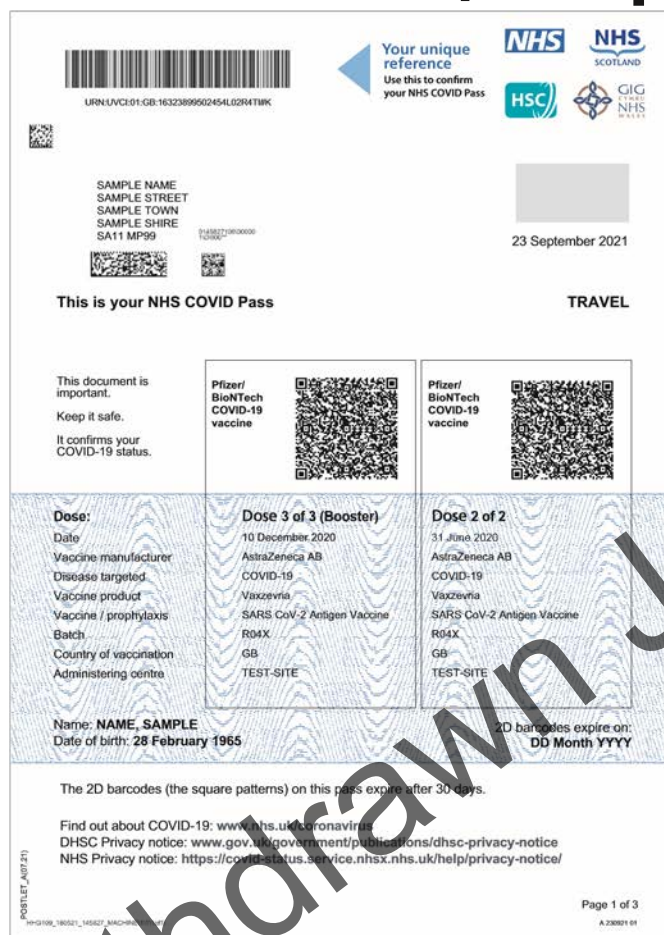
Пример: Страница 1