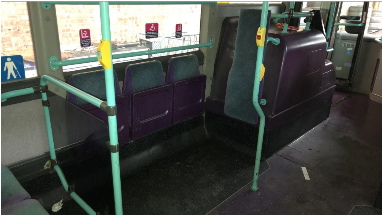
Ffigur 4 Man cadair olwyn bws sy'n wynebu tuag yn ôl (DVSA)

Goleuadau: y gofynion ar gyfer goleuo y tu mewn a thu allan i'r cerbyd er mwyn hwyluso mynediad diogel i ddefnyddwyr cadeiriau olwyn.