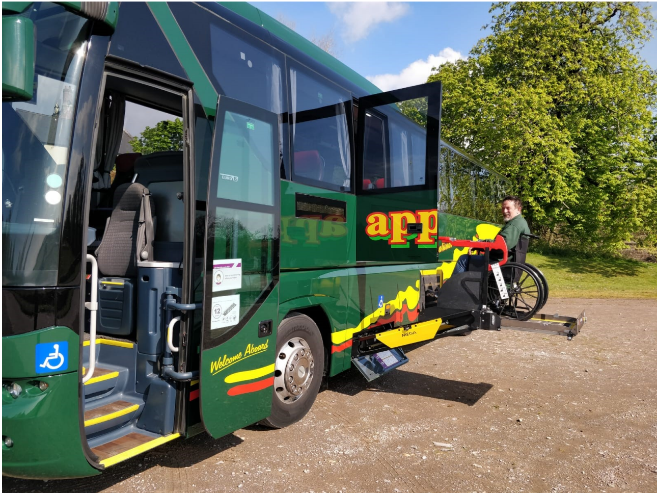
Ffigur 6 Defnyddiwr cadair olwyn yn mynd i mewn i goets drwy lifft ochrlwytho. (Redfern Travel)

Mae'r Adran yn ymwybodol o ddatblygiadau newydd mewn technoleg codi cadeiriau olwyn. Er enghraifft, mae liffitiau coetsis ochrlwytho mewnol yn cael eu gweithredu ym Mrasil gyda seddi a reolir o bell nad oes angen codi'r teithiwr yn uchel i'r awyr. Fodd bynnag, ni fyddai'r math hwn o lifft yn bodloni gofynion y PSVAR gan na all gynorthwyo defnyddiwr cadair olwyn na all drosglwyddo o'i gadair, er enghraifft. Mae enghreifftiau sy'n cydymffurfio â PSVAR o fynediad lifft a ramp i gadeiriau olwyn yn cynnwys yr arddull yn ffigur 6, a liffitiau 'sqi-locer' ochrlwytho . Hoffem annog ymatebwyr i roi eu barn a'u syniadau i ni ar unrhyw ddulliau arloesol o fynd i'r afael â hygyrchedd bysiau a choetsys. Gallai hyn gynnwys awgrymiadau sy'n mynd y tu hwnt i ofynion y PSVAR.