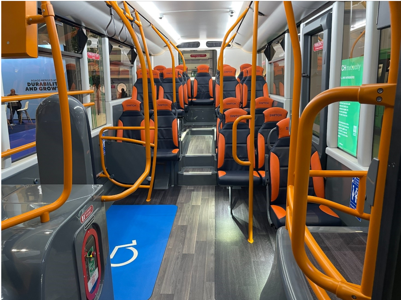
Ffigur 5 Tu mewn i fws yn dangos y man cadair olwyn, canllawiau a gafaelion llaw, seddi a grisiau (DfT)