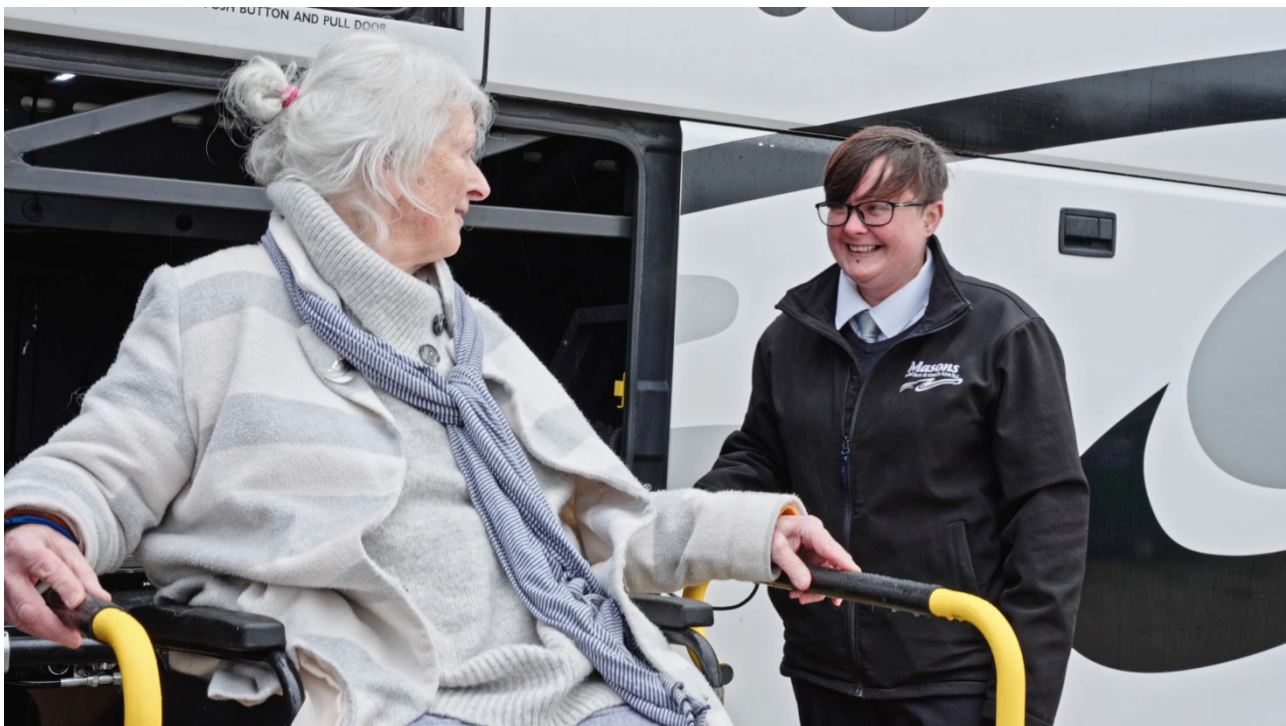
Ffigur 2 Teithwraig hŷn yn defnyddio lifft coets sy'n llwytho ar yr ochr sy'n cydymffurfio â PSVAR (CPT)

Mae'r PSVAR yn llywodraethu'r gofynion hygyrchedd ar gyfer bysiau a choetsis sy'n darparu gwasanaethau lleol ac wedi'u hamserlennu gyda chapasiti o fwy na 22 o deithwyr, yn ogystal â'r gyrrwr.