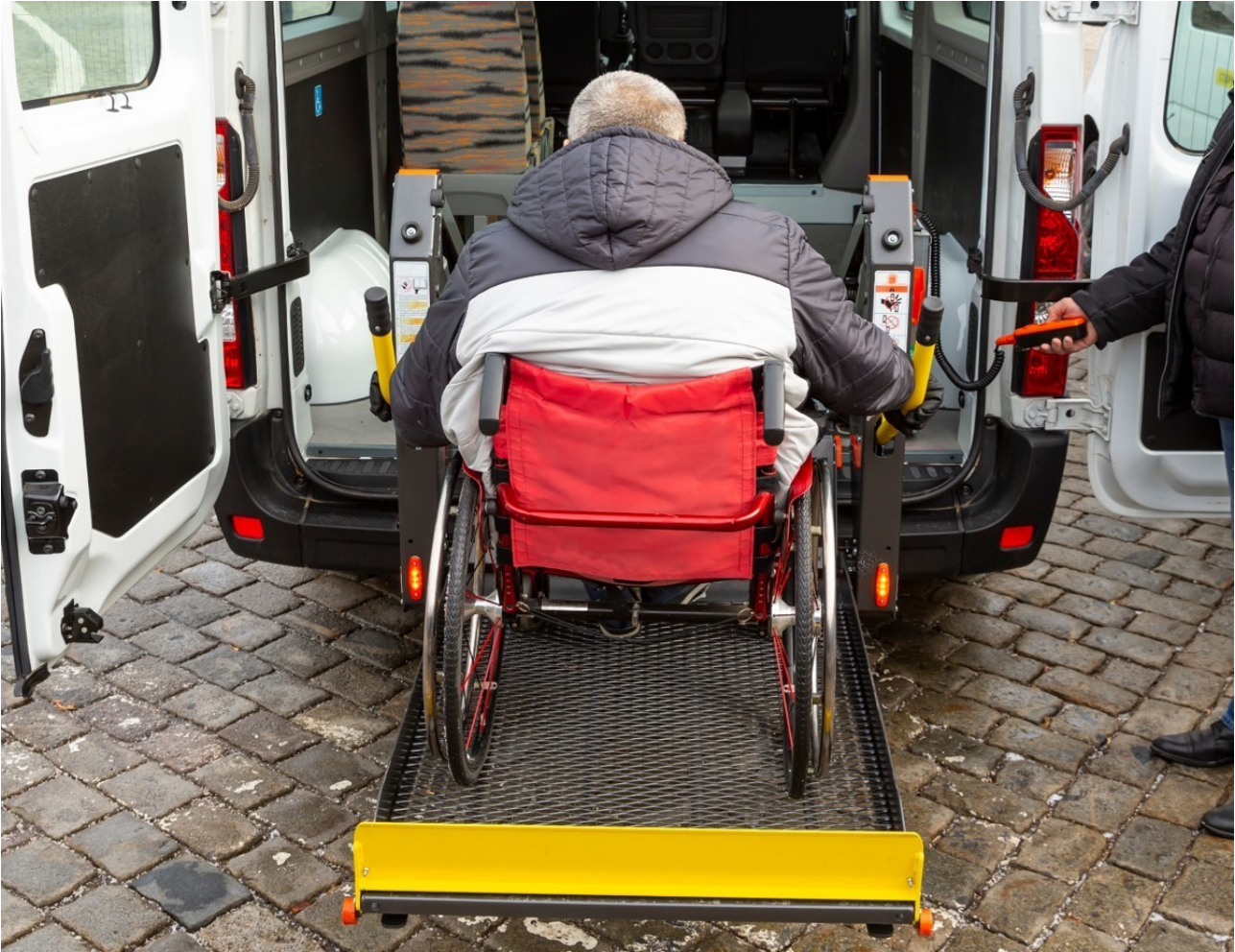
Ffigur 3 Defnyddiwr cadair olwyn yn mynd i mewn i fws mini cludiant cymunedol hygyrch (Cymdeithas Cludiant Cymunedol)