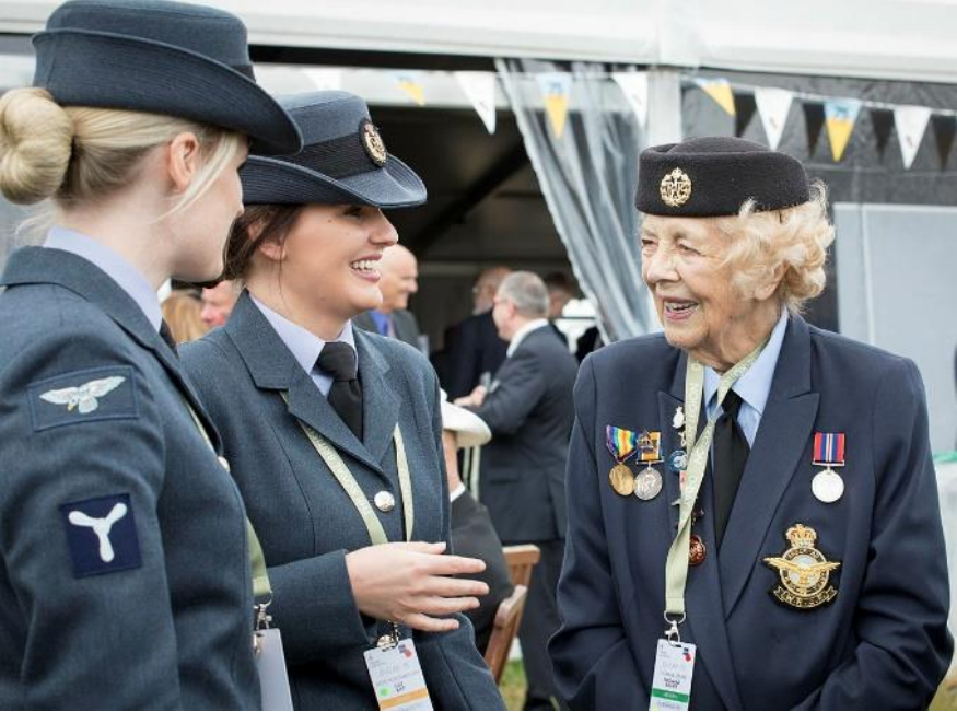
Mae aelodau o'r Llu Awyr Brenhinol sy'n gwasanaethu yn siarad â chyn-aelod o'r llw.