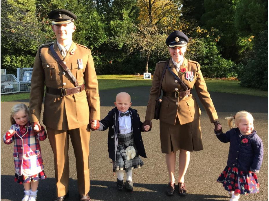
Cwpl a'r ddau yn gwasanaethu a'u plant.