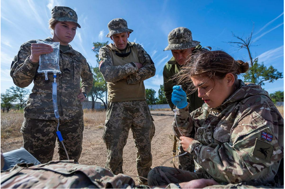
Aelod Gatrawd Feddygol 16 yn rhoi hyfforddiant meddygol ar drawma i feddygon o Wcráin.