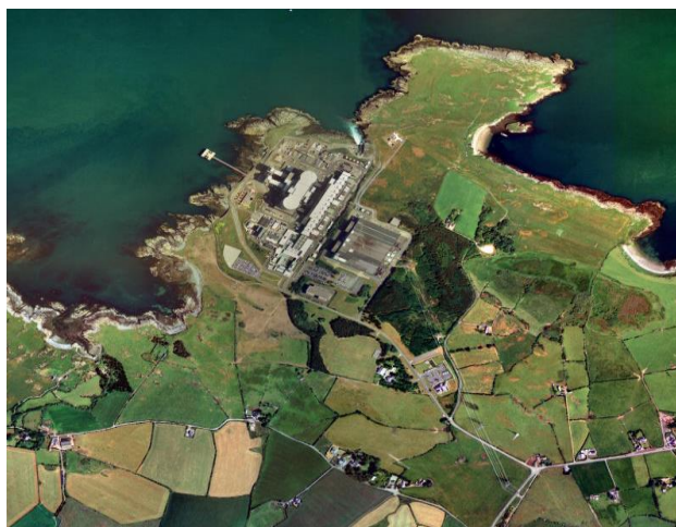
Ffotograff 1 - Llun o'r awyr o Safle Wylfa a'r Dirwedd oddi Amgylch

Mae Môr Iwerddon yn terfynu â'r orsaf bŵer tua'r gogledd, y gogledd-ddwyrain a'r gogledd-orllewin ac mae caeau amaethyddol am y ffin ag ef tua'r de-ddwyrain, y de, a'r de-orllewin. Mae'r arfordir o gwmpas yr orsaf bŵer yn cynnwys pentiroedd caregog gyda baeau bach, y mae rhai ohonynt yn dywodlyd. Hyd arfordir y daliad tir cyfan yw tua 2km. Mae'r rhan o'r arfordir sy'n union gyfagos i safle'r drwydded niwclear tua 750m o hyd. Tir pori garw a geir gan mwyaf yn agos i'r arfordir gyda cherrig brig a llwyni eithin. Ymhellach o'r môr ceir tir ffermio isel â phantiau bach a choetiroedd ar wahân lle mae coed wedi'u plannu arno gan mwyaf.