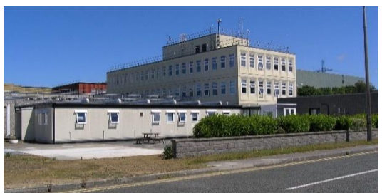
Ffotograff 6 – Estyniad yr adeilad gweinyddol – cyn ac ar ôl y gwaith dymchwel yn 2022.