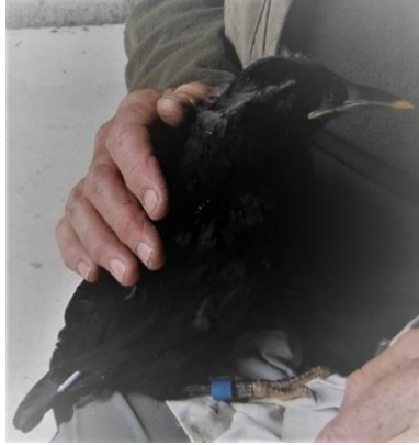
Ffotograff 11 - Ecolegydd trwyddedig yn modrwyo cyw brân goesgoch ar y safle yn 2021

Rydym hefyd wedi ceisio cyngor ar sut i reoli'r pâr o frain coesgoch sy'n byw ar y safle er mwyn gwneud yn siŵr ein bod yn rhoi camau priodol ar waith i gefnogi'r rhywogaeth brin hon o adar trwy gydol ein gweithgareddau. Mae mesurau i noddi prosiectau ar y cyd â 'Pŵer Niwclear Horizon' i fynd ati'n weithredol i reoli'r gwaith o warchod gwarchodfa natur leol Mynydd y Wylfa a SoDdGA Tre'r Gof wedi cael eu rhoi ar waith. Bydd y gwelliannau hyn yn hyrwyddo bioamrywiaeth y safleoedd dynodedig pwysig hyn ac yn gwella ardaloedd bwydo'r frân goesgoch a safleoedd nythu posibl ar y pentir ar yr un pryd.