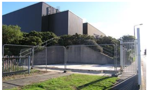
Ffotograff 8 – Yr Hen Borthdy Diogelwch - cyn ac ar ôl y gwaith dymchwel yn 2022.

Gwnaed nifer o geisiadau 'Hysbysiad Ymlaen Llaw' ar gyfer y gwaith hwn i Gyngor Sir Ynys Môn yn 2021/22 a chymeradwywyd y rhain fel 'Datblygiad a Ganiateir' yn dilyn hynny. Mae'r garreg filltir bwysig hon wedi caniatáu dymchwel/tynnu'r adeiladau hyn yn