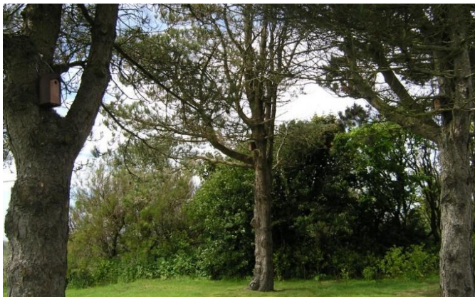
Ffotograff 10 - Blychau ystlumod ac adar a osodwyd ar safle Wylfa yn 2022

Mae mesurau lliniaru ecolegol wedi cael eu rhoi ar waith eleni ar sail nifer o arolygon a gynhaliwyd mewn perthynas ag ardaloedd a nodwyd ar gyfer eu dymchwel. Mae'r mesurau lliniaru hyn yn cynnwys gosod blychau ystlumod ac adar ar y safle i gefnogi'r gwaith o adleoli ystlumod y gallai'r gwaith datgomisiynu sydd ar fin digwydd effeithio arnynt. Cydnabuwyd hefyd y bydd angen cysylltu â Cyfoeth Naturiol Cymru ac ecolegydd cymwysedig i sicrhau y ceir y trwyddedau bywyd gwyllt priodol cyn dechrau ymgymryd â gweithgareddau gwaith penodol.