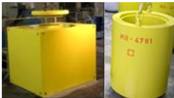
Ffotograff 9 - DCICs fydd y deunydd pacio a ddewisir ar gyfer ILW yn Wylfa

Bydd y prosiect hwn yn cefnogi'r gwaith o reoli Gwastraff Lefel Ganolraddol (ILW) Wylfa yn y dyfodol drwy bennu nodweddion a mesur stocrestr ILW y safle er mwyn cefnogi'r broses o'i adennill a'i amgáu yn llwyddiannus. Bydd hyn yn gweithredu fel sail ar gyfer gofynion storio cyfleuster storio Cynhwysydd Haearn Bwrw Hydwyth (DCIC) newydd ar gyfer ILW yn y dyfodol i fodloni'r strategaeth dadfeiliad a storio tymor hir.