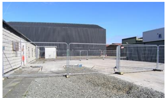
Ffotograff 7 – Swyddfeydd y Gangen Beirianeg - cyn ac ar ôl y gwaith dymchwel yn 2022.