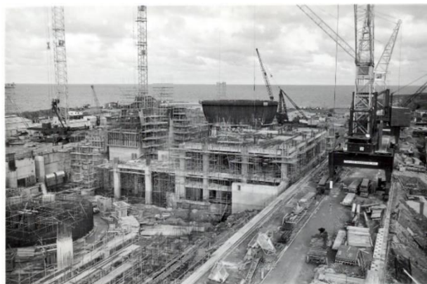
Ffotograffau - 12 a 13 - Wylfa yn ystod y cyfnod adeiladu tua 1965

Bydd yr effeithiau o ran sŵn, dirgrynu a llwch sy'n cael eu creu yn ystod gweithgareddau dymchwel yn cael eu rheoli i sicrhau bod eu heffeithiau ar y gymuned leol a derbynyddion amgylcheddol yn cael eu rheoli a'u lleihau'n ddigonol. Cynhaliwyd trafodaethau â Swyddog Iechyd yr Amgylchedd Cyngor Sir Ynys Môn a bydd yr holl argymhellion yn cael eu rhoi ar waith a'u rheoli yn unol â chynghor y swyddog hwnnw a