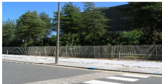
Ffotograff 5 - Offer Anadlu (BA) a Chyfleuster Hyfforddi – cyn ac ar ôl eu dymchwel yn 2022.