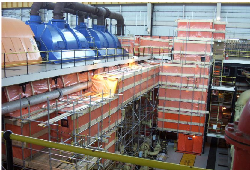
Ffotograff 3 - Tynnu Asbestos o'r Neuadd Dyrbinau yng Ngorsaf Bŵer Hinkley Point A

Bydd asbestos anymbelydrol yn cael ei fagio ddwywaith yn ei gyflwr gwlyb ar ôl ei dynnu, fel na fydd unrhyw wastraff hylifol i'w brosesu o'r gwaith tynnu ei hun. Anfonir asbestos anymbelydrol i safleoedd gwaredu asbestos trwyddedig oddi ar y safle. Bydd asbestos ymbelydrol, a fydd yn wastraff ymbelydrol lefel isel, yn cael ei anfon i gyfleuster cywasgu, gyda'r dŵr gwastraff a gynhrychir drwy'r broses hon yn cael ei hidlo i dynnu unrhyw ffibrau asbestos cyn anfon yr asbestos cywasgedig i'r Storfa Gwastraff Lefel Isel ger Drigg. Bydd asbestos ymbelydrol y gellir ei alw'n wastraff ymbelydrol lefel isel iawn (VLLW) yn gallu cael ei waredu mewn cyfleusterau gwaredu trwyddedig priodol eraill.