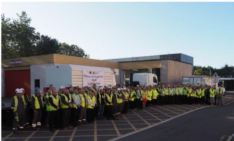
Ffotograff 4 - Staff yn Wylfa yn ymgynnull o flaen y fflasg olaf o danwydd wedi'i ddefnyddio i adael y safle (Medi 2019)

Ar ôl gorffen tynnu tanwydd a chael dilysiad di-danwydd yn Hydref 19, mae Wylfa wedi mynd ymlaen i'r cam Paratoadau Gofal a Chynnal a Chadw. Dyma gam cyntaf datgomiynu. Yn ystod y cam hwn y bydd y rhan fwyaf o'r adeiladau a'r peiriannau ymbelydrol ac anymbelydrol ar y safle (heblaw am adeilad yr adweithydd a Chelloedd Storfa Sych Eilaidd 4/5 o bosib) yn cael eu datgymalu a'u clirio.