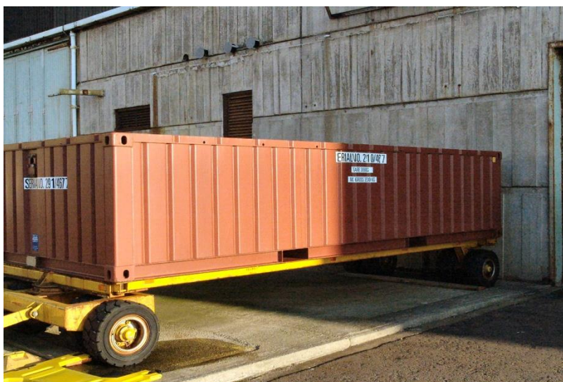
Ffotograff 2 - Enghraifft o gynhwysydd ISO hanner uchder yn disgwyl cael ei gludo o un o safleoedd Magnox i'r Storfa Gwastraff Lefel Isel

Trosglwyddir elfion ymbelydrol hylifol y mae angen eu gwaredu i'r gwaith Trin Elifion Actif i'w prosesu a'u gwaredu. Ar ôl i gynhyrchu'r elfion ddod i ben, bydd y gwaith Trin Elifion Actif yn cael ei ddatgomisiynu. Caiff hyn ei gwblhau cyn mynd i'r cam Gofal a Chynnal a Chadw.