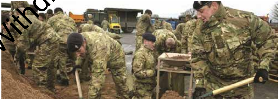
Milwr Prydeinig yn defnyddio llenwr bagiau tywod BCB yn ystod y llif