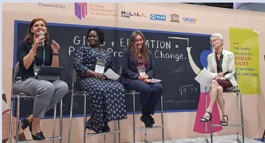
性别平等问题特使乔安娜·罗珀 (Joanna Roper) 于 2019 年 6 月温哥华妇女交付大会期间在女孩教育讨论组上发言

距离实现可持续发展目标只剩下十年时间,我们将继续努力推进行动,于 2030 年让所有女孩都能接受 12 年优质教育,同时实现可持续发展目标 4。英国是平等权利联盟的联席主席,特别关注可持续发展目标的重要性,以及联合国“不让任何人落下”的承诺,可持续发展目标的相关性将是 5 月份英国主办的 LGBT (女同性恋、男同性恋、双性恋与跨性别者) 权利会议的一个要点。