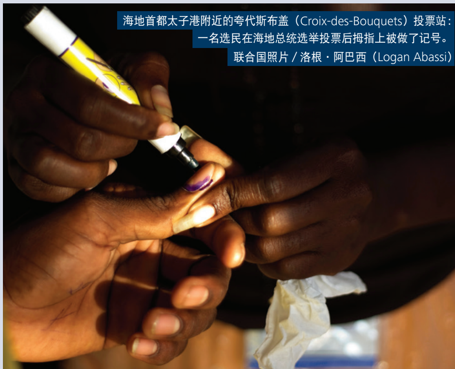
海地首都太子港附近的夸代斯布盖（Croix-des-Bouquets）投票站：

英国将支持人权维护者和民间团体在任何合适的时候参与联合国事务，并将努力反对报复，为人权维护者和民间团体代表创造安全的环境。英国长期以来一直通过双边交往支持人权维护者，并通过多边系统内焦点明确的交往提高全球标准。我们认识到人权维护者在促进和捍卫民主方面的重要作用，并将在人权理事会内努力确保他们能够发挥这一作用。我们还将通过我们的大宪章基金（Magna Carta Fund），继续支持捍卫民主价值观和民间团体的举措，直接援助人权维护者的事业。