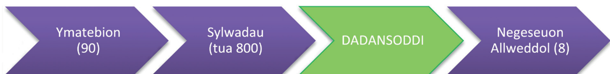
Ffigur 2: O ble daeth yr 8 Neges Allweddol

Ar ôl dadansoddi'r 90 cyfraniad unigol, gwnaethom nodi tua 800 o sylwadau neu bwyntiau unigol a oedd wedi'u codi gan yr ymatebwyr. Roedd ein dadansoddiad yn caniatáu i ni nodi unrhyw themâu cyffredin a rhestr o'r 'Negeseuon Allweddol' a godwyd yn ystod y prosesau ymgynghori yng Nghymru a Lloegr. Roedd 8 Neges Allweddol yn deillio o'r ymatebion.