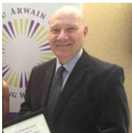
Ian Barrow Cyfarwyddwr Y Gwasanaeth Prawf Cenedlaethol

Wrth argymhell yr adroddiad hwn i chi, gobeithiwn ei fod yn rhoi mewnwleddiad gwerthfawr i'n gwaith ac yn cynnig sicrwydd bod diogelu'r cyhoedd ac anghenion dioddefwyr yn parhau i fod y flaenoriaeth bennaf.