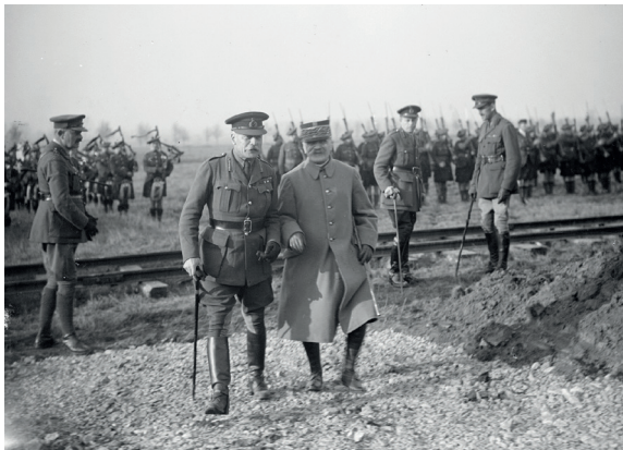
Image: Marshal Ferdinand Foch, the Supreme Commander of the Allied Forces, and Field Marshal Douglas Haig, the C-in-C of the British Army, after the inspection of the Guard of honour of the C Company, 6th Battalion, Gordon Highlanders at Ligny, 15 November 1918.

Both Foch and Haig had been accused of excessive optimism, keen to continue offensives which they ought to have closed down. Now they were the right men in the right place, ready to exploit the opportunities which presented themselves with a frequency which discombobulated politicians and even surprised Haig. Foch began to realise that the war could be won before 1919,