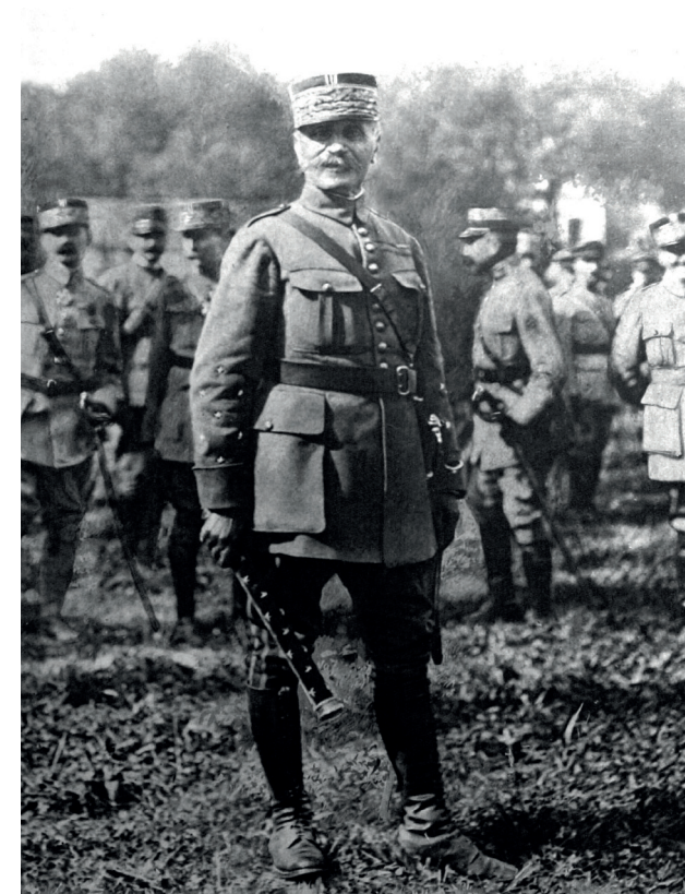
World War I. The commander's baton was turned over to Marshal Foch by the president of the French Republic (August 23, 1918).

The Department for Digital, Culture, Media and Sport, supported by 10 Downing Street, the Foreign and Commonwealth Office, the Ministry of Defence, the Department for Education, the Ministry of Housing, Communities and Local Government and other stakeholders, and working in partnership with key delivery partners, is the lead UK Government Department for the commemoration of the First World War. The Secretary of State for Digital, Culture, Media and Sport chairs an expert advisory panel to oversee the four-year programme, building a commemoration fitting of this significant milestone in world history.