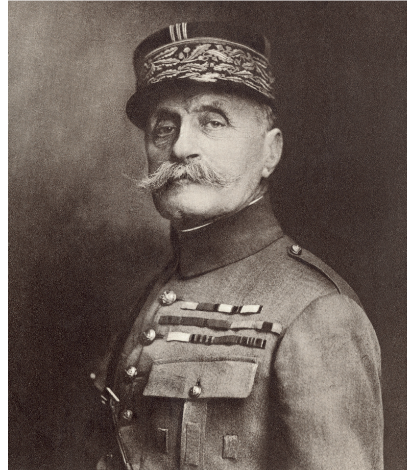
Statue du maréchal Foch, Lower Grosvenor Gardens, Victoria, Londres