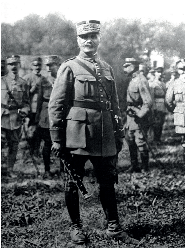
Première Guerre mondiale. Le bâton de maréchal fut remis au maréchal Foch par le président de la République française, le 23 août 1918. © Alamy Images CW5XA1