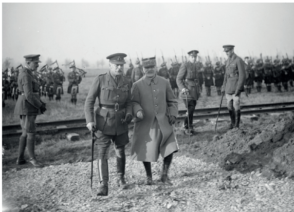
Image: le maréchal Ferdinand Foch, commandant suprême des forces alliées, et le maréchal Douglas Haig, commandant en chef de l'armée britannique, après l'inspection de la garde d'honneur de la compagnie C du 6e bataillon des Gordon Highlanders à Ivuy, le 15 novembre 1918.

Autrefois accusés d'optimisme excessif, et d'avoir prolongé des offensives qu'ils auraient dû arrêter, Foch et Haig sont désormais les hommes qu'il faut, là où il faut. Ils sont prêts à exploiter les occasions qui se présentent, à une fréquence qui déconcerte les hommes politiques et surprend même Haig. Foch commence à prendre conscience de la possibilité d'une victoire avant