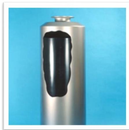
Enghreifftiau o wastraff ymbelydrol uwch ei actifedd (ILW ac HLW)