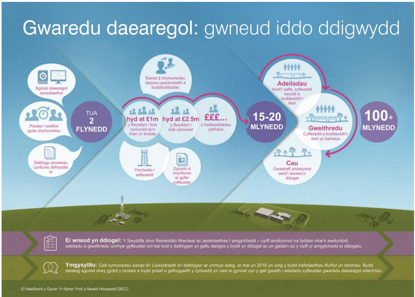
Diagram yn dangos y broses at y dyfodol