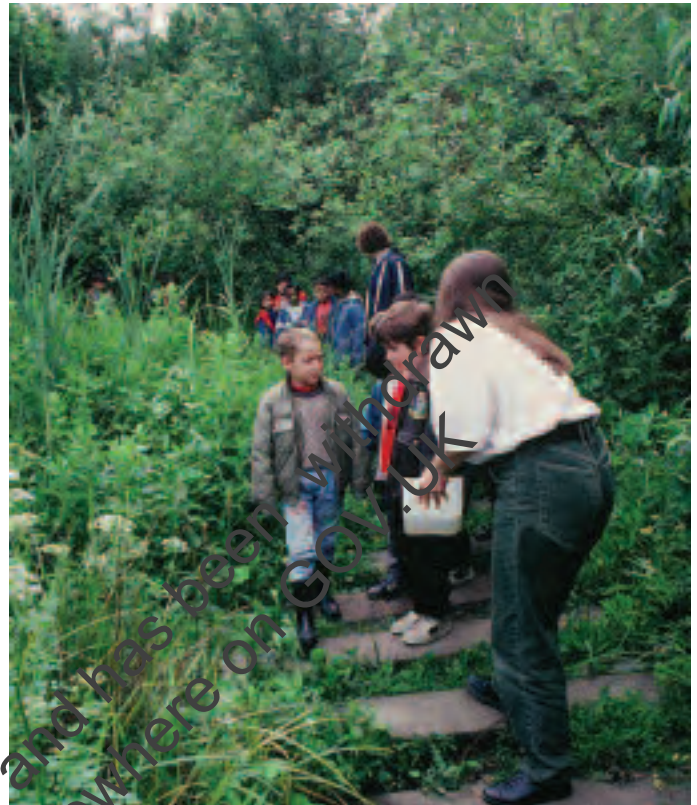
Dysgu am fywyd pyllau