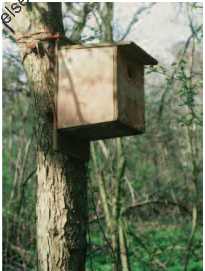
Gwarchodfa Natur Leol Shortwood – blwch adar isel

Anogir prosiectau bioamrywiaeth ar tiroedd ysgolion o dan y rhaglen Eco-ysgolion, sy'n ceisio darparu fframwaith syml i alluogi ysgolion i ddadansoddi eu gweithrediadau a dod yn fwy