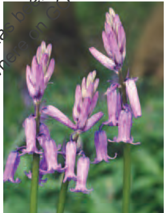
Clychau'r Gog, Thorpe Wood, Peterborough