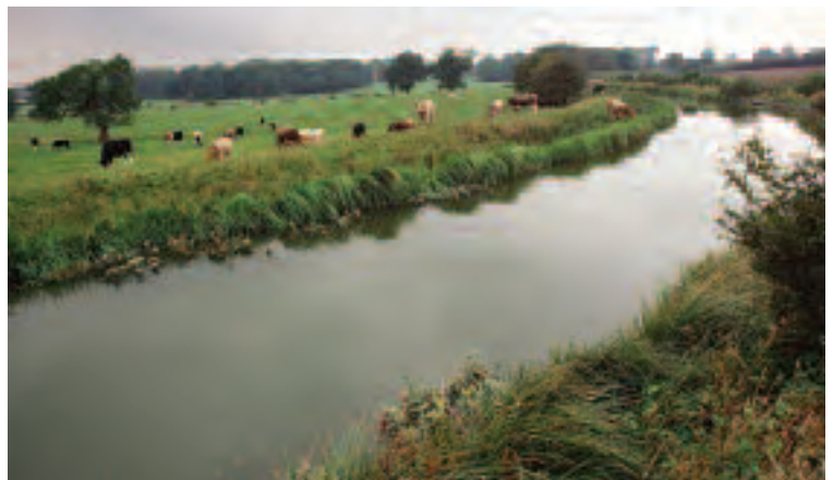
Kilby – Safle o Ddiddordeb Gwyddonol Arbennig Camlas Foxton

Mae llawer o gynefinoedd a rhywogaethau â blaenoriaeth yng Nghynllun Gweithredu Bioamrywiaeth y DU a Chynlluniau Gweithredu Bioamrywiaeth Lleol yn dibynnu ar reoli cynefinoedd tir ffermio a choetir mewn ffordd gydymdeimladol 32 . Gall awdurdodau cyhoeddus chwarae rhan allweddol i annog tenantiaid i wella'r gwaith o reoli'r tir er bioamrywiaeth, drwy eu cytundebau tenantiaeth.