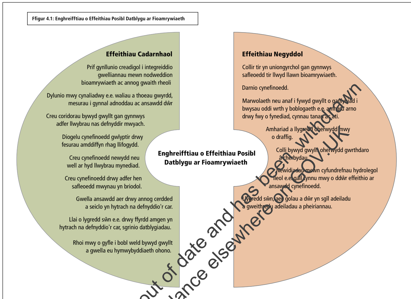
Figur 4.1: Enghreifftiau o Effeithiau Posibl Datblygu ar Fioamrywiaeth