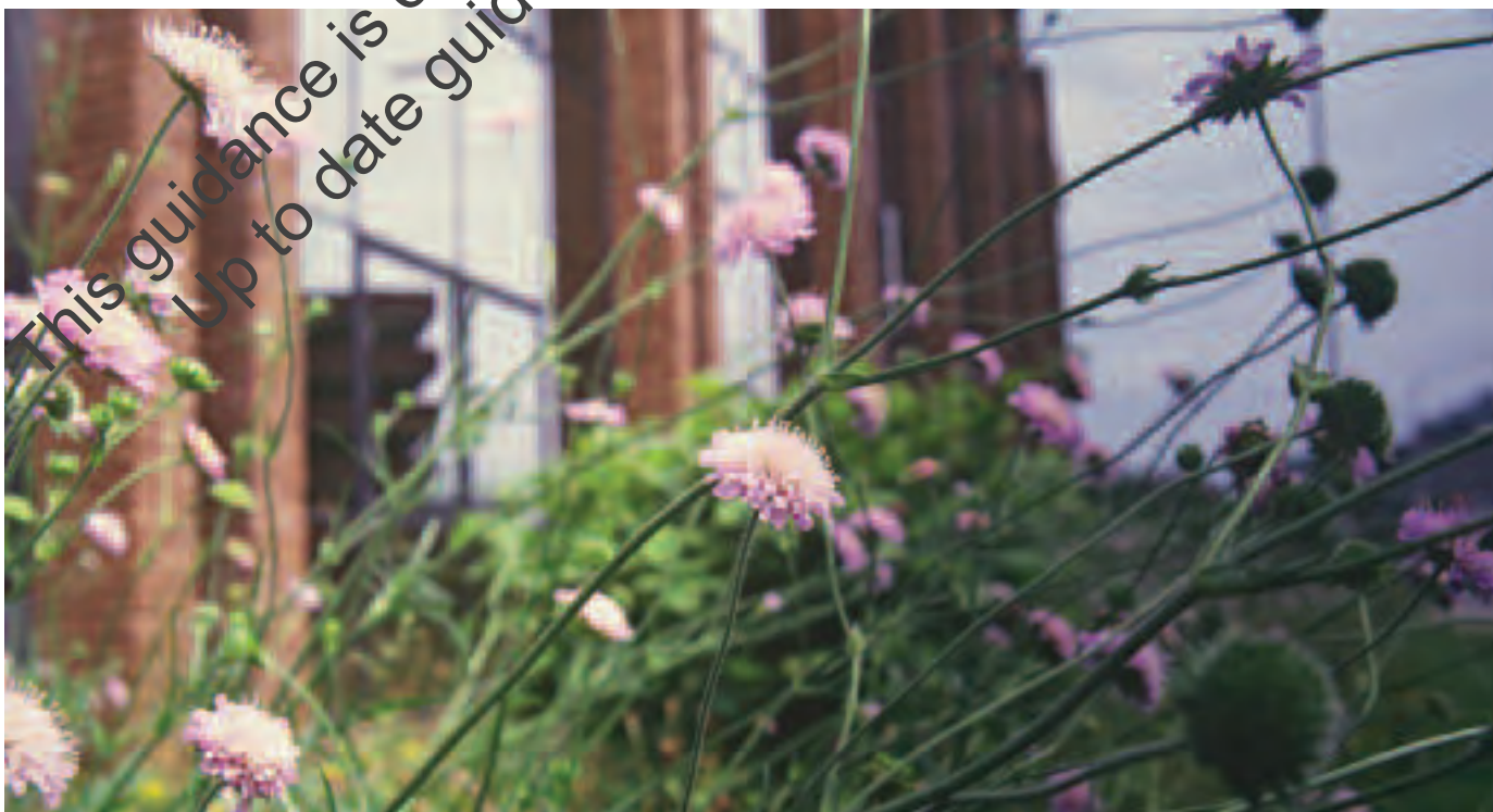
Gardd bywyd gwylt Tŷ Northminster Natural England