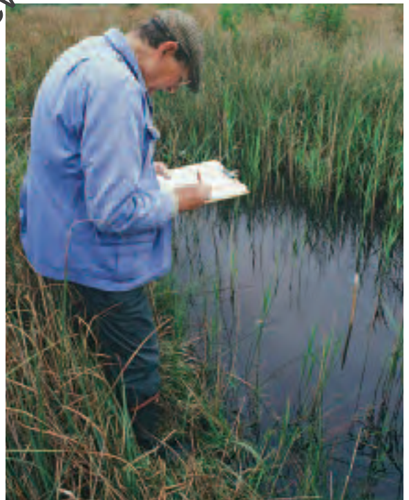
Safle o Ddiddordeb Gwyddonol Arbennig Redgrave a Lopham

Mae'r astudiaethau achos canlynol yn rhoi nifer o enghreifftiau o brosiectau ymgysylltu â'r gymuned sy'n ymwneud â bioamrywiaeth.