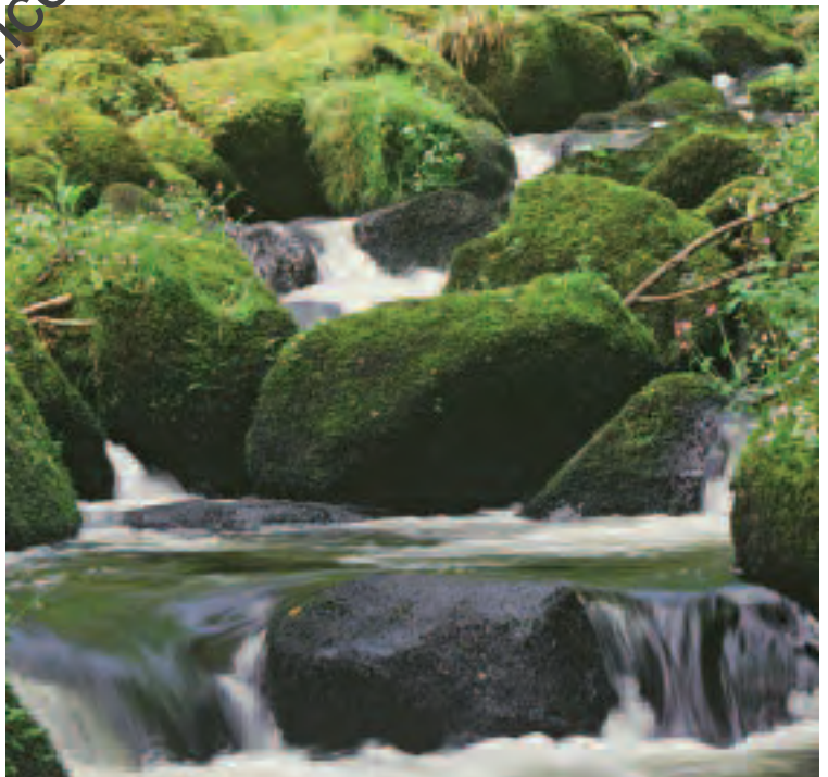
Coedwig Dyffryn Bovey, Gwarchodfa Natur Genedlaethol Coetiroedd a Rhostiroedd Dwyrain Dartmoor

Detholir Safleoedd Lleol gan bartneriaethau lleol oherwydd eu gwerth gwarchod natur sylweddol. Mae dros 35,000 o Safleoedd Lleol yn Lloegr, ac mae awdurdodau lleol yn berchen ar lawer ohonynt neu'n eu rheoli.