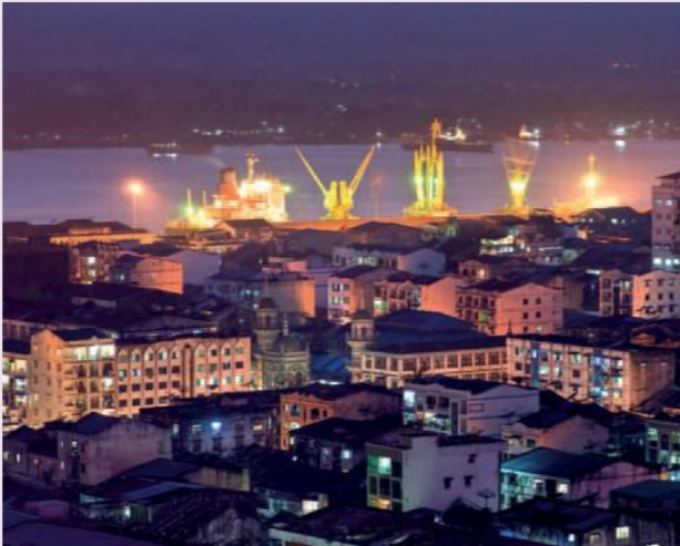
အထက်ပုံ။ ရန်ကုန်မြို့ ကမ်းနားမှ ဝန်ချီစက်များ

မြန်မာနိုင်ငံ၏ လူဦးရေနှင့် မြေထုမှာ ပြင်သစ်နိုင်ငံနီးပါး ရှိပါသည်။ သို့ရာတွင် စီးပွားရေးကမူ ပြင်သစ်၏ ၁.၇ % ပမာဏမျှသာ ရှိပေသည်။ ၂၀ ရာစု အစပိုင်းတွင် မြန်မာနိုင်ငံ၏ တစ်ဦးချင်း ပြည်တွင်း အသားတင်ထုတ်လုပ်မှု တန်ဖိုးမှာ တရုတ်နှင့် တောင်ကိုရီးယားနိုင်ငံ တို့ထက် များပြားခဲ့ပါသည်။ ဆယ်စုနှစ်ပေါင်းများစွာ စီးပွားရေး စီမံခန့်ခွဲမှု ညံ့ဖျင်းခြင်း၊ ပဋိပက္ခ၊ နိုင်ငံတကာနှင့် အဆက်ပြတ်ခြင်းများ၏ အကျိုးဆက်အဖြစ် ယနေ့ မြန်မာနိုင်ငံ၏ တစ်ဦးချင်း အသားတင်ထုတ်လုပ်မှု တန်ဖိုး ၈၈၄ ဒေါ်လာက မြန်မာနိုင်ငံအား အရှေ့တောင်အာရှတွင် အဆင်းရဲဆုံးနိုင်ငံ ဖြစ်နေစေပါတော့သည်။