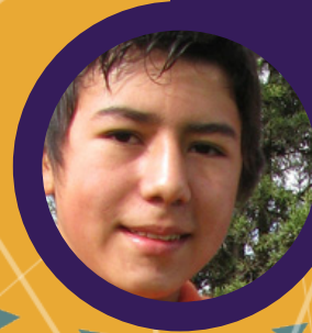
Sylw Person Ifanc

"Mae llawer o bobl ifanc yn troseddu dim ond i fachu sylw eu teuluoedd a chael cymorth gwasanaethau, ac maen nhw'n aildroseddu er mwyn dal i gael cymorth. Mae'n anodd cefnu ar hyn."