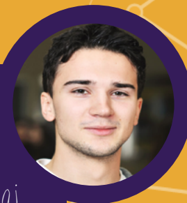
Sylw Person Ifanc

"Fe ddylech chi gael un gweithiwr wedi'i aseinio i chi o'r tim troseddau ieuencid sy'n aros gyda chi trwy gydol y broses, fe ddylai pethau fod yn fwy cyson."