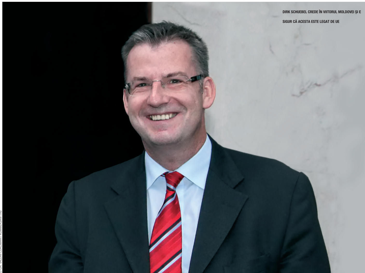
DIRK SCHUEBEL CREDE ÎN VIITORUL MOLDOVEI ȘI E SIGUR CĂ ACESTA ESTE LEGAT DE UE

ȘEFUL DEPARTAMENTULUI PENTRU ȚĂRILE PARTENERIATULUI ESTIC ÎN CADRUL SERVICIULUI EUROPEAN PENTRU ACȚIUNE EXTERNĂ, DIRK SCHUEBEL, A DISCUTAT CU CORESPONDENTUL GUIDE, ALEXANDR STAHURSCHI, DESPRE AȘTEPTĂRILE UNIUNII EUROPENE FAȚĂ DE REPUBLICA MOLDOVA LA CAPITOLUL REFORME, PRECUM ȘI DESPRE TEMERILE MOLDOVENILOR PRECUM CĂ ȚARA NOASTRĂ VA AVEA DOAR DE PIERDUT DUPĂ SEMNAREA ACORDULUI DE ASOCIERE.