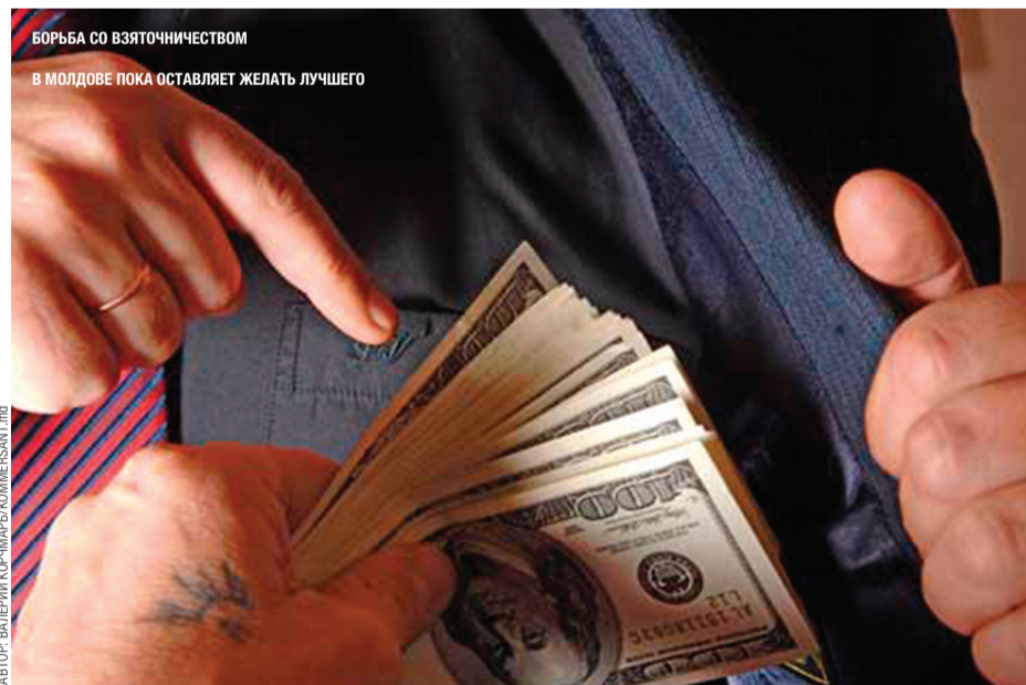
АВТОР: ВАЛЕРИЙ КОРЧМАРЬ/КОММЕРСАНТ.РУ

«ЭТО БЕСПРЕЦЕДЕНТНЫЙ СЛУЧАЙ, КОГДА ЕВРОПЕЙСКИЙ СОЮЗ ОКАЗЫВАЕТ ТАКУЮ КРУПНУЮ ФИНАНСОВУЮ ПОМОЩЬ ДЛЯ РЕФОРМЫ ЮСТИЦИИ В СТРАНЕ, НЕ ЯВЛЯЮЩЕЙСЯ ЧЛЕНОМ ЕВРОСОЮЗА»