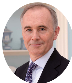
駐日英国大使 ティム・ヒッチンズ

ぜひ、英国パビリオンで美味しい英国を発見していただき、皆様のビジネスにつなげていただけますようお願いしております。