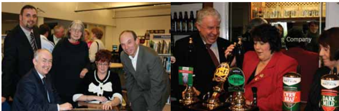
Left: Wayne David launching digital inclusion project in New Tredegar Right: Paul Murphy visiting Tomos Watkins Brewery in Swansea