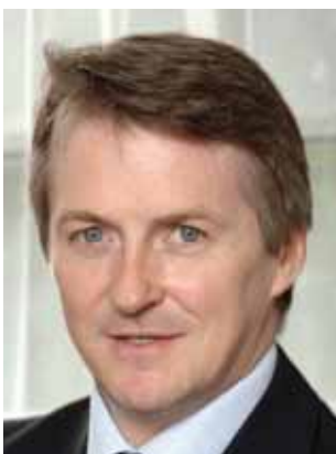
Huw Irranca-Davies MP

Both Ministers also undertake a busy programme of meetings, visits and functions with a wide range of organisations in Wales. Examples are referred to throughout this report.