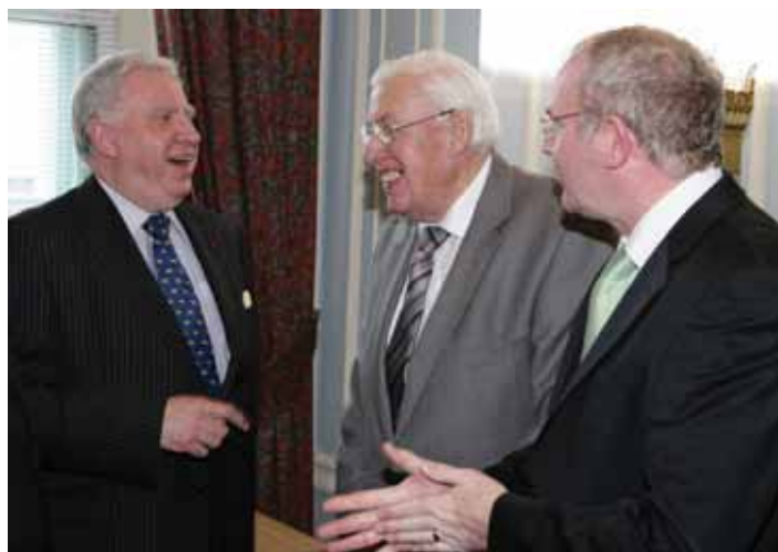
Paul Murphy with Northern Ireland First Minister Ian Paisley and Deputy First Minister Martin McGuinness in Belfast