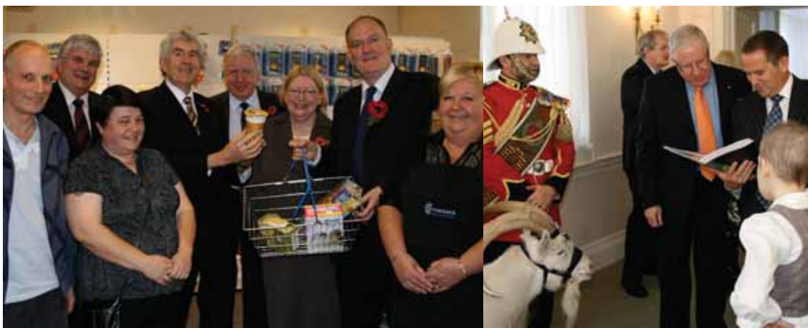
Left: Paul Murphy visiting a Rhyl City Strategy project with First Minister Rhodri Morgan Right: Paul Murphy welcoming representatives from Welsh children's charity LATCH to the Wales Office