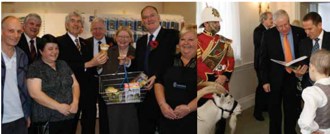
Chwith: Paul Murphy yn ymweld â phrosiect Strategaeth Dinas y Rhyl gyda Prif Weinidog Rhodri Morgan Dde: Paul Murphy yn croesawu cynrychiolwyr o elusen plant Cymru LATCH i Swyddfa Cymru