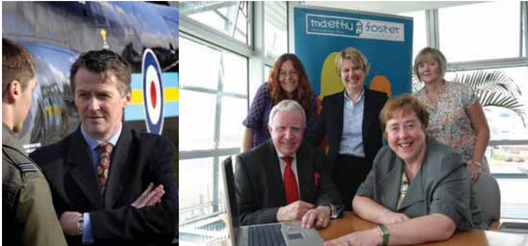
Huw Irranca-Davies visiting RAF Valley Paul Murphy at the launch of the Looked After Children project in Llanelli