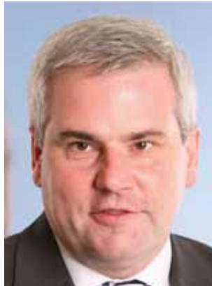
Mark Tami MP, Government Whip with responsibilities for Welsh Labour MPs (right)