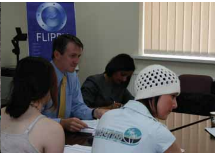
Chwith: Paul Murphy yn ymweld â grŵp prosiect cymdogaeth mwy diogel yn Nhorfaen Dde: Huw Irranca-Davies yn cyfarfod myfyrwyr yng Ngholeg Pen-y-Bont