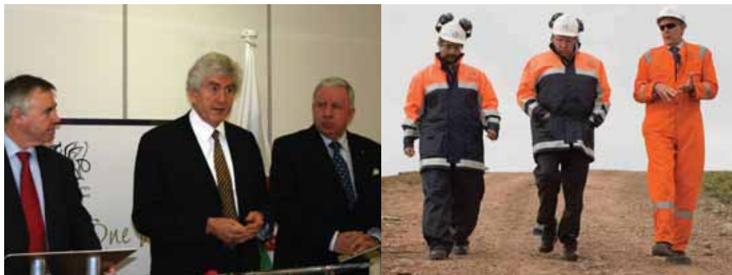
Left: Paul Murphy with First Minister Rhodri Morgan and Deputy First Minister Ieuan Wyn Jones at the first All-Wales Economic Summit Right: Paul Murphy during a visit to the South Hook, LNG terminal in Milford Haven