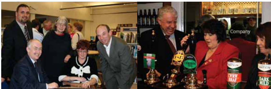
Chwith: Wayne David yn lansio prosiect cynhwysiant digidol yn Nhredegar Newydd Dde: Paul Murphy yn ymweld â Bragdy Tomos Watkins yn Abertawe