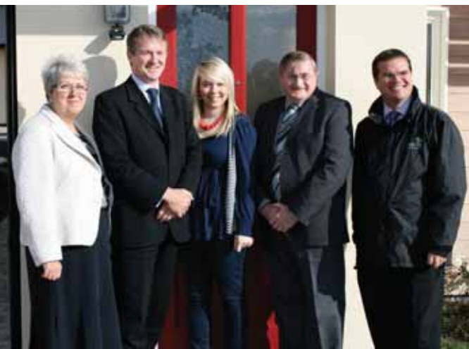
Left: Huw Irranca-Davies visiting JobCentre Plus in Wrexham Right: Huw Irranca-Davies visiting an affordable housing scheme in Crickhowell