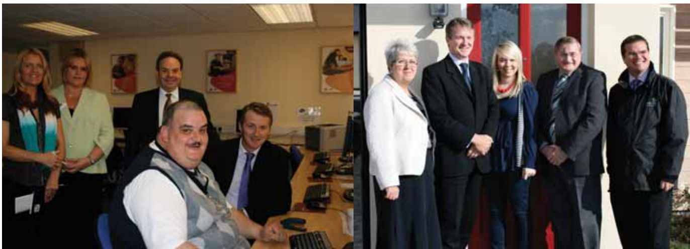
Chwith: Huw Irranca-Davies yn ymweld â Chanolfan Byd Gwaith yn Wrexham Dde: Huw Irranca-Davies yn ymweld â chynllun tai fforddiadwy yng Nghrucywel