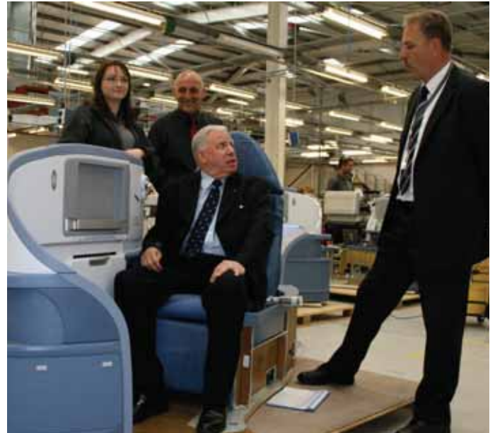
Paul Murphy visiting Contour Premium Aircraft Seating in Llantarnam