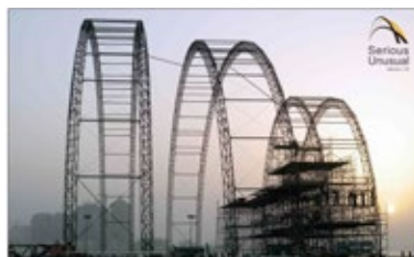
Fan Fests em 9 de 12 cidades sede - estruturas temporárias - Serious International

Estruturas temporárias, sinalização, construção de overlays no entorno dos estádios, iluminação, tratamento acústico e equipamentos de som, catering, gestão de resíduos, suprimento de energia e segurança, treinamento de stewards e voluntários, em gerenciamento de estádios, serviços de emergência.