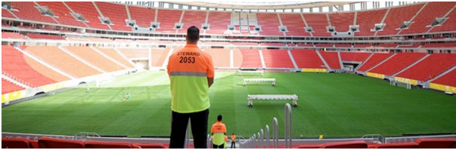
Stadium Mané Garrincha – serviços de stewards – Sword Security