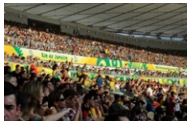
Sinalização e decoração de estádio CSM e Icon

Seguro, gerenciamento de riscos e de crises, plano de continuidade de negócio, projeto financeiro, serviços legais e de arbitragem, término de contrato, normas internacionais e compliance e proteção a marca.