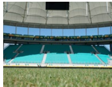
Arena Fonte Nova - estruturas temporárias Arena Group e Blue Cube

Centro de operações de controle e comando, segurança na área interna e externa dos estádios, vigilância, defesa cibernética, treinamento de pessoal especializado, segurança de visitantes estrangeiros.