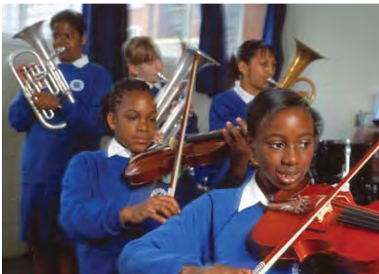
Plant yn chwarae offerynnau cerddorol