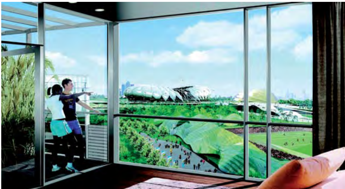
Y Pentref Olympaidd

Mae'r De Orllewin yn anfon grŵp o lysgenhadon diwylliannol ifanc i Tsieina yn ddiweddarach eleni i sefydlu cysylltiadau yn Beijing a Qingdao (lleoliad y digwyddiadau hwyllo Olympaidd yn 2008).