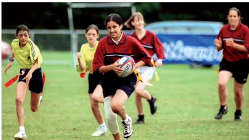
Gêm rygbi merched

Mae pob Cenedl yn datblygu ei chynllun ei hun o ran sut i gyflawni'r addewid hon.