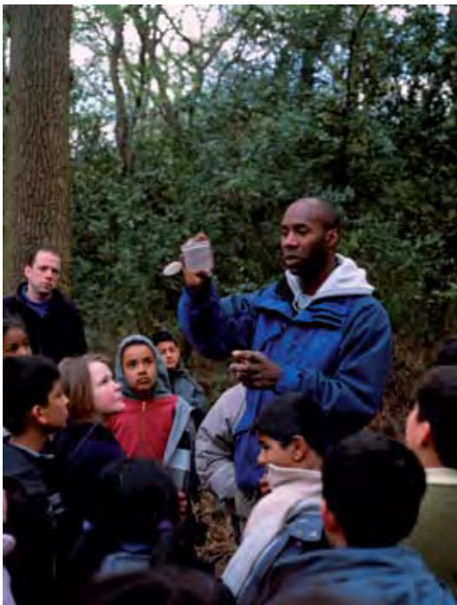
Athro gyda dosbarth. Coedwig yn y Gwanwyn. Epping Forest.