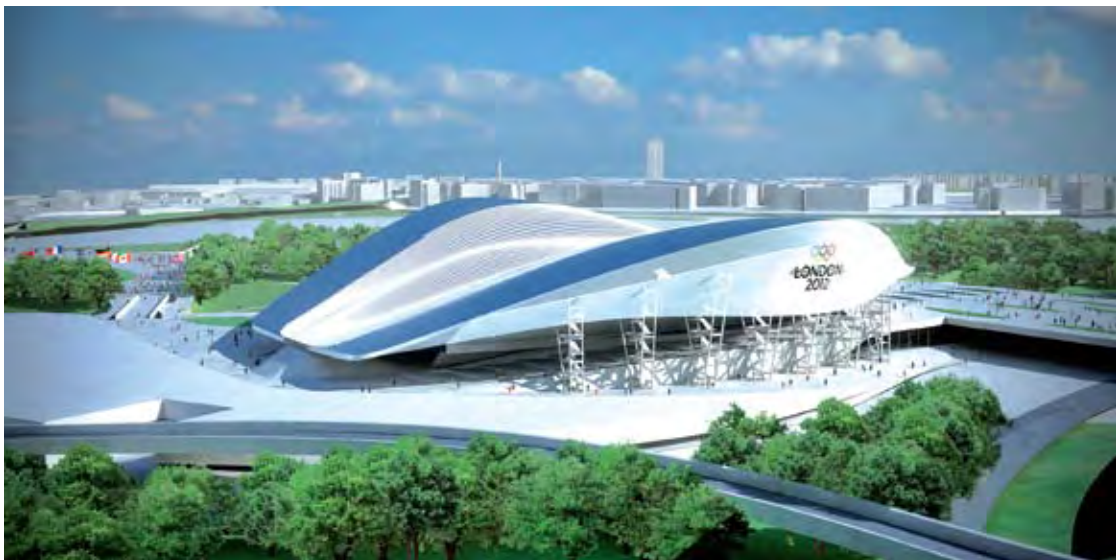
Argraff arlunydd o'r Ganolfan Ddyfrol newydd

Mae Dwyrain Lloegr wedi gosod nod iddo'i hun o ennill cytundebau cysylltiedig â Gemau 2012 sy'n werth £100 miliwn i'r economi – £50 miliwn o'r diwydiant adeiladu a'r gweddill o sectorau creadigol a chlundant.