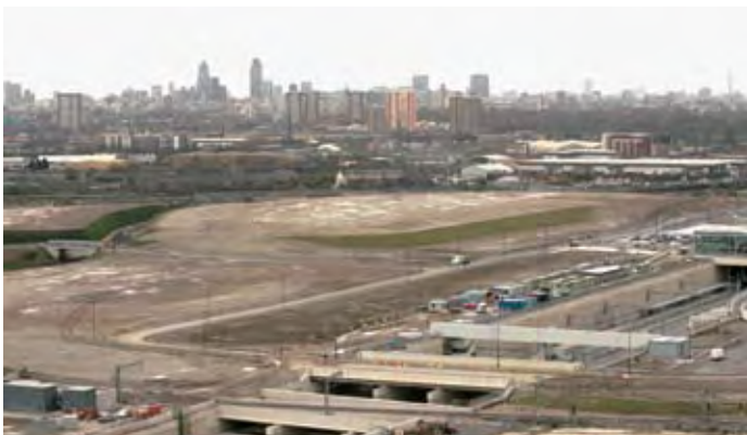
Mae gwaith ar droed eisoes ar safle'r parc Olympaidd yn Nwyrain Llundain