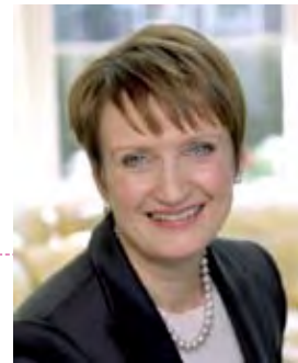
Tessa Jowell Gweinidog y Gemau Olympaidd