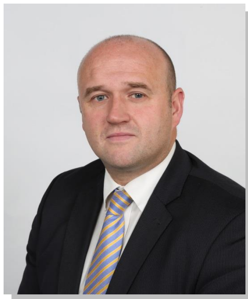
Dafydd Llywelyn Comisiynydd yr Heddlu a Throsedd

Am ragor o wybodaeth am waith Swyddfa Comisiynydd yr Heddlu a Throsedd, galwch heibio i'm gwefan ar www.dyfed-powys-pcc.org.uk .