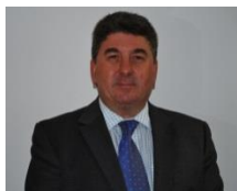
Sr. Embajador de Su Majestad Británica en Nicaragua Chris Campbell

Esperamos que como estudiante, académico, profesional o ciudadano mundial encuentre este folleto como fuente de información útil sobre algunas de las opciones que ofrece la educación superior del Reino Unido. El Gobierno de su Majestad se enfoca en la calidad para dar una buena plataforma al éxito para los estudiantes. ¿Por qué no desarrollar su propio "poder" y unirse a la larga lista de premios Nobel o empresarios y empresarias que han optado por estudiar en el Reino Unido en busca de una vida mejor?