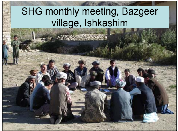
SHG monthly meeting, Bazgeer village, Ishkashim