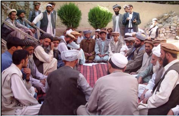
Regular monthly meeting of SHG, Upper Sooch village, Jurm