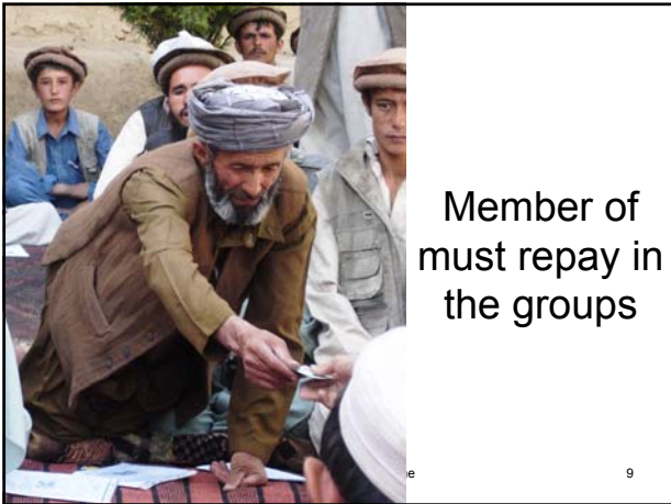
Member of must repay in the groups