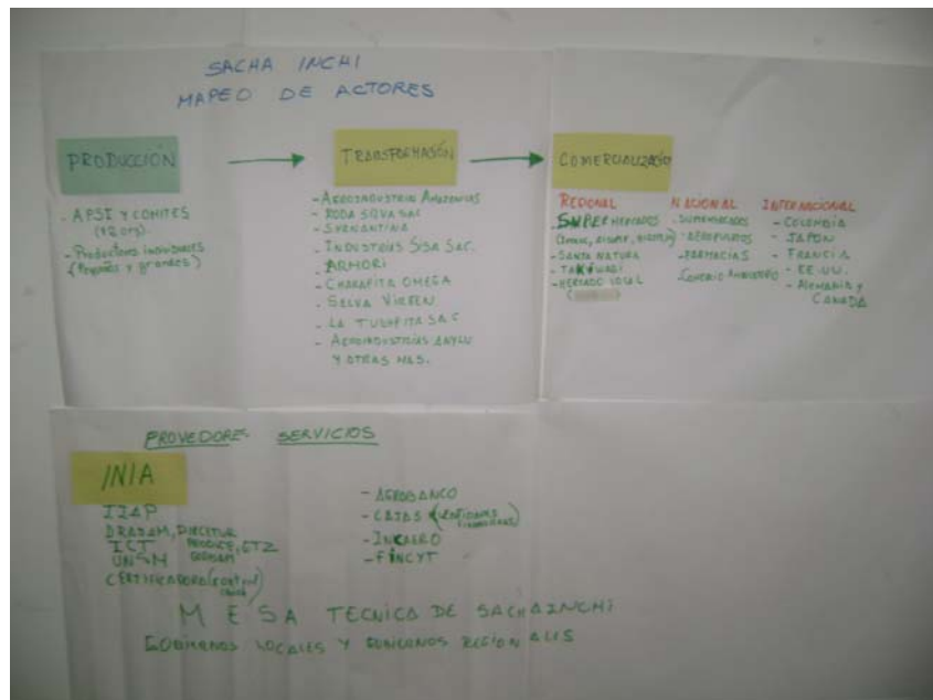
CADENA PRODUCTIVA DEL SACHA INCHI