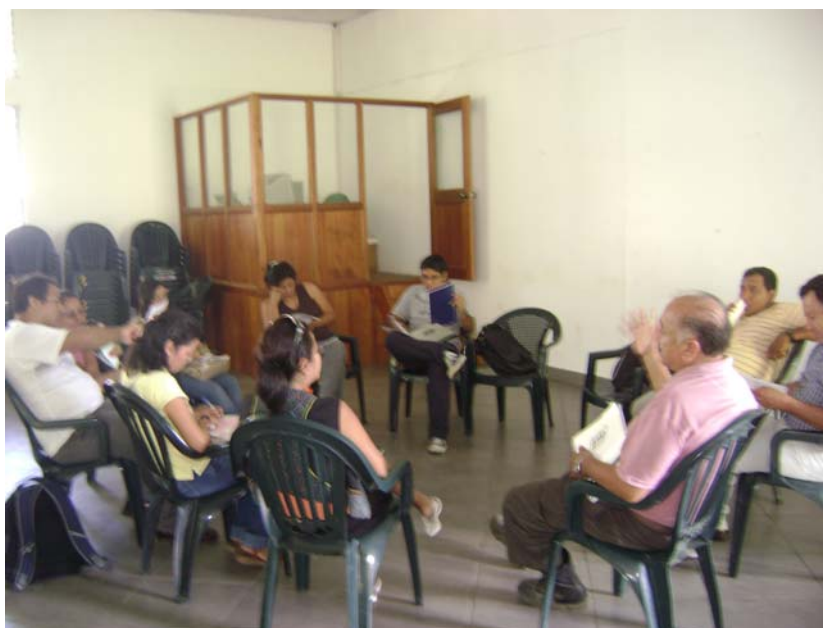
GRUPO DE SACHA – INCHI EN PLENO TRABAJO