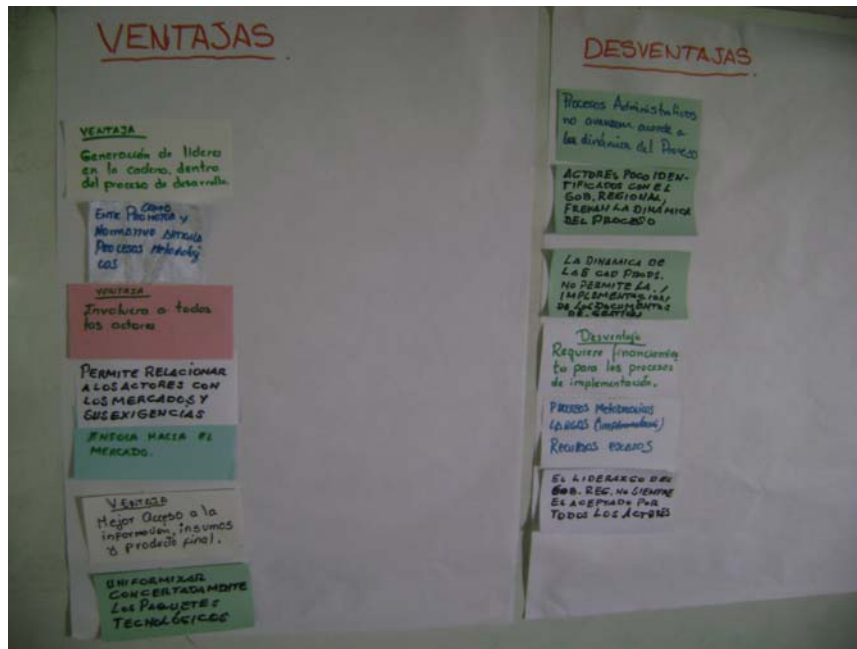
VENTAJAS Y DESVENTAJAS ATRIBUIDAS AL EPCP POR UNO DE LOS GRUPOS DE TRABAJO