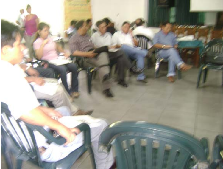
GRUPO DE GANADERIA – LECHE EN PLENO TRABAJO

Conforme se puede apreciar, el grupo de ganadería – leche – derivados lácteos, maneja diferentes alternativas para el financiamiento de las actividades del EPCP.