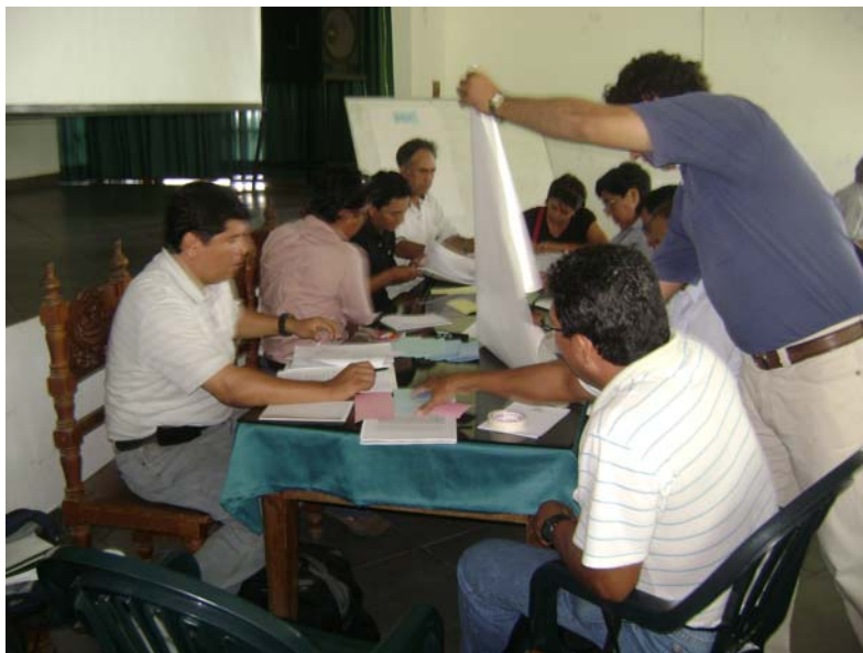
GRUPO DE PIJUAYO EN PLENO TRABAJO

La primera alternativa es la más firme para lograr recursos, aunque no se descarta tocar otras puertas que permitan continuar con las innovaciones del EPCP, empleando métodos participativos.