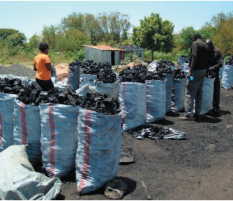
Makaa yaliyoagizwa kutoka nchi jirani kupitia ziwa Victoria yakiuzwa kisiwani Ndunga, Kisumu

Majukumu ya Vyama vya Ushirika vya Wazalishaji/wachomaji Makaani pamoja na: