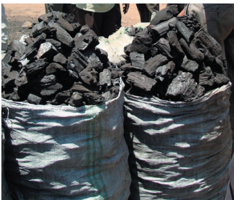
Makaa hupakiwa katika vipimo tofauti

HATUA 3 Tuma habari zilizopakiliwa awali (ii) kwa Kamati ya Kuhifadhi Misitu (FCC) na kulipa ada maalum. Ada hizi hubadilishwa kila baada ya muda fulani.