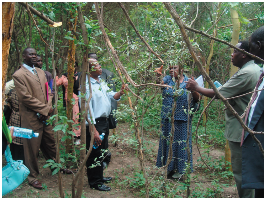
Washiriki katika warsha ya kujifunza kusimamia miti katika shamba la Musaki, Kitengela