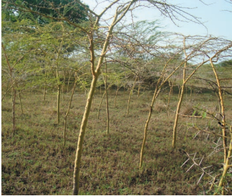
Vichaka vya miti ya Acacia vya Kikundi cha Kina Mama wa Masanga huko Rarieda, Nyanza