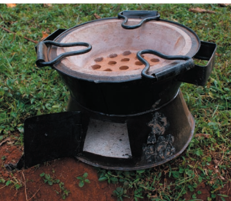
Jiko linalotumia makaa