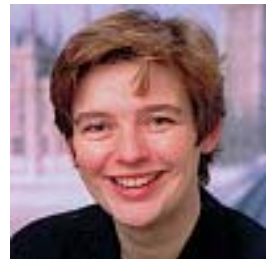
Ruth Kelly Ysgrifennydd Economaidd

Fe ail-etholwyd y Llywodraeth hon ar addewid i gyflawni gwelliannau arwyddocaol i wasanaethau cyhoeddus. Er mae anaml y bydd cofrestru genedigaethau, priodasau a marwolaethau yn cyrraedd y tudalennau blaen, mae yn wasanaeth hanfodol sydd yn cyffwrdd â phawb yn ystod eu bywyd. Mae gwreiddiau'r system yng Nghymru a Lloegr yn y bedwaredd ganrif ar bymtheg. Ers hynny, mae anghenion cymdeithas, teuluoedd ac unigolion wedi newid mewn amryw ffyrdd. Mae angen moderneiddio i adlewyrchu a chefnogi'r newidiadau hyn. Mae cynlluniau'r Llywodraeth yn darparu mwy o ddewis, gwell darpariaeth gwasanaeth ac arloesi.