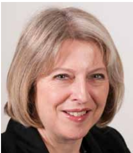
Y Gwir Anrhydeddus Theresa May AS Ysgrifennydd Cartref a Gweinidog Menywod a Chydraddoldeb

Nid yw hyn yn ymwneud â'r Llywodraeth yn ymyrryd â bywydau phobl, mae'n ymwneud â darparu dewis yn ein cymdeithas fodern. Yn syml, os yw ymrwymiad a phriodas yn beth da ni ddylem gyfyngu cyplau un rhyw i briodas sifil yn unig.