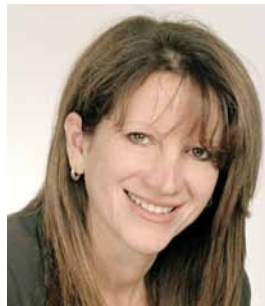
Lynne Featherstone AS Gweinidog Cydraddoldeb